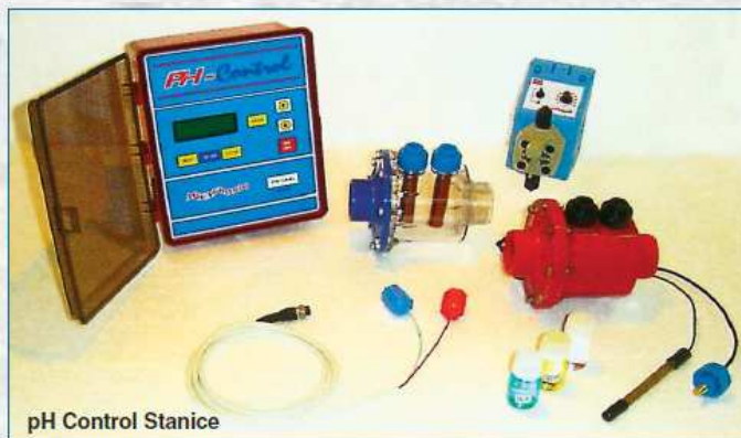
pH Control Stanice

Aqua-Sky, pH plus/minus Control Stanice obsahuje: Elektronický panel s mikroprocesorem, měřící průtokovou nádobu, nádobu pro elektrody, měděno-stříbrné elektrody a potřebné kabely pro napojení, měřící průtokovou nádobu pH, teplotní sondu, pH sondu a pouzdro sondy.