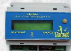
Laguna na DIN lištu