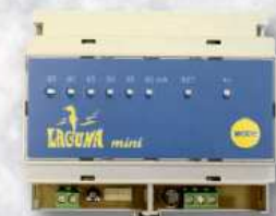
Laguna mini na DIN lištu