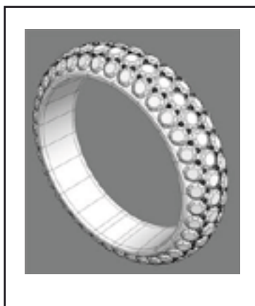
2. 3D model - podklad pro výrobu