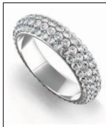
3. hotový šperk

Této služby využívají nejvíce Ti, kteří např. zdělili po předcích část soupravy a rádi by ji měli kompletní nebo lidé, které oslovil někde na někom šperk, ale nikde v obchodech ho neobjevili. Neváhejte nás kontaktovat a my Vám poradíme.